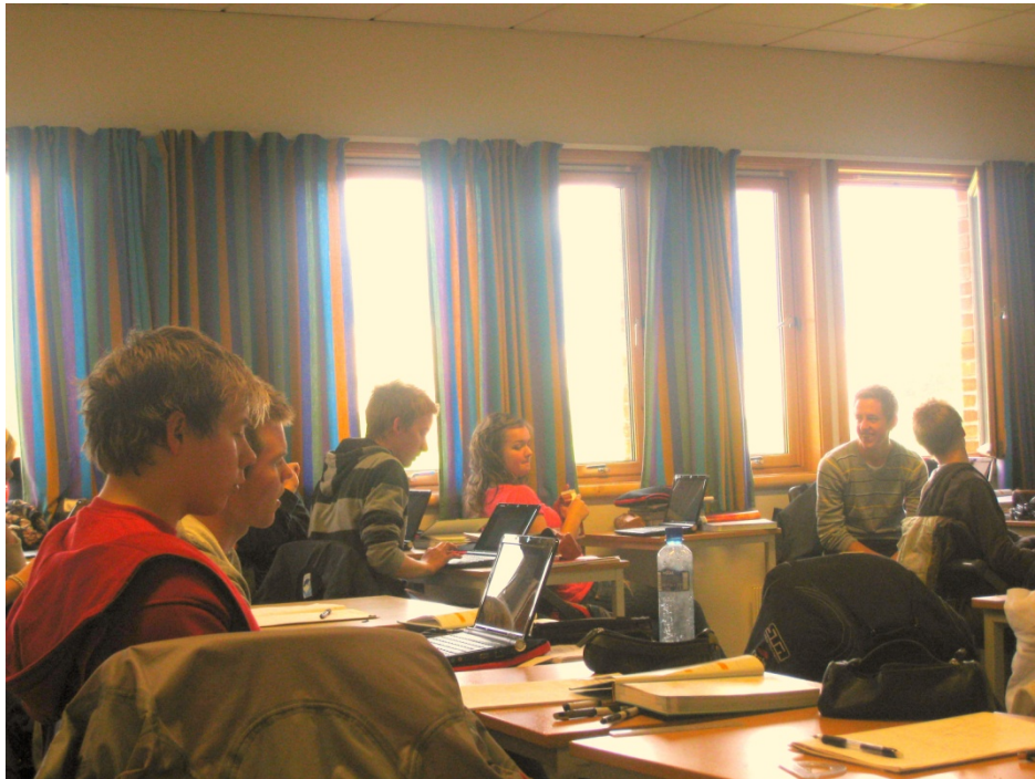
På klasserommet, konsentrerte elever som samarbeider godt.